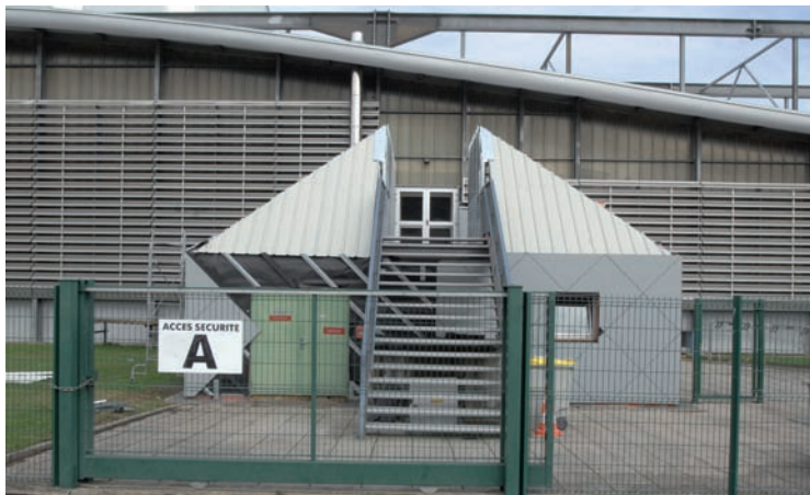
L'entrée orange du gymnase Jacques Anquetil est en cours de rénovation. Somme investie : 70 000 euros TTC.