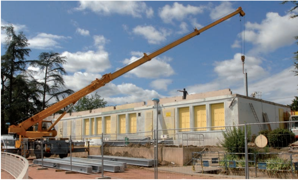
La maison des sports a été bâtie sur l'ancien club house du rugby qui a également fait l'objet d'une rénovation.