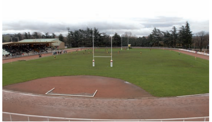
Au premier étage, une vue panoramique offre une place de choix lors des rencontres au stade de la Libération.