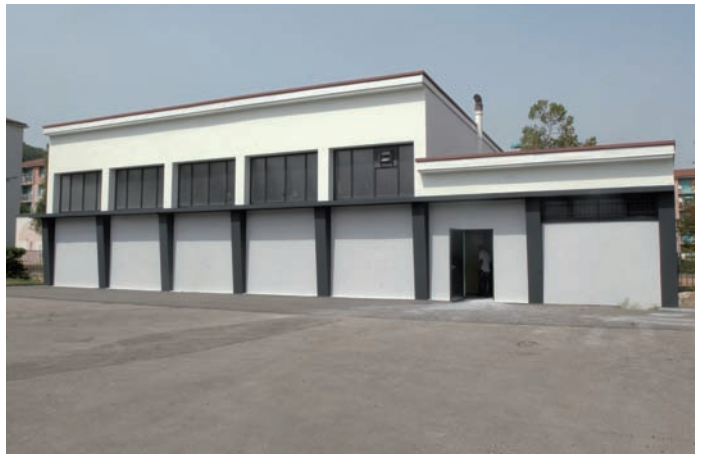
Le gymnase Joliot-Curie a fait peau neuve. De grands travaux ont été menés pour un montant s'élevant à 100 000 euros.