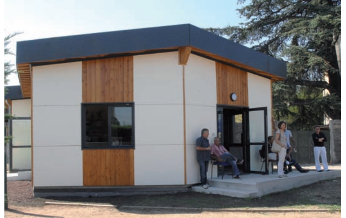
Le club house du football Tony Garcia sorti de terre en mai dernier à coûté 160 000 euros

Le club house du football au stade Tony Garcia récemment construit a nécessité un investissement de 160 000 euros. Dorénavant elle accueillera les équipes dans des locaux flambants neufs d'une superficie de 100M 2 .